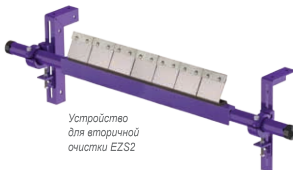
Устройство для вторичной очистки EZS2

Flexco Europe GmbH • Leidringer Strasse 40-42 • D-72348 Rosenfeld • Deutschland Tel: +49-7428-9406-0 • Fax: +49-7428-9406-260 • E-mail: europe@flexco.com