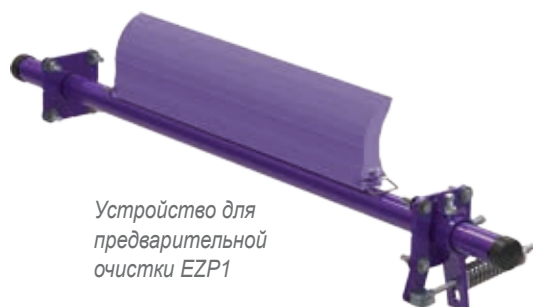
Устройство для предварительной очистки EZP1

Для наиболее эффективной очистки используйте вместе с устройством для предварительной очистки и устройством для вторичной очистки.