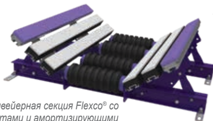
Конвейерная секция Flexco® со скатами и амортизирующими роликами CoreTech (EZSB-I)