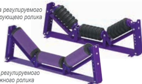
Рама регулируемого натяжного ролика