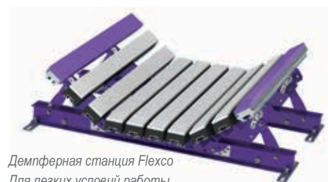
Демпферная станция Flexco Для легких условий работы (EZIB-L)